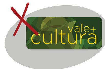
Não inserir elementos não previstos